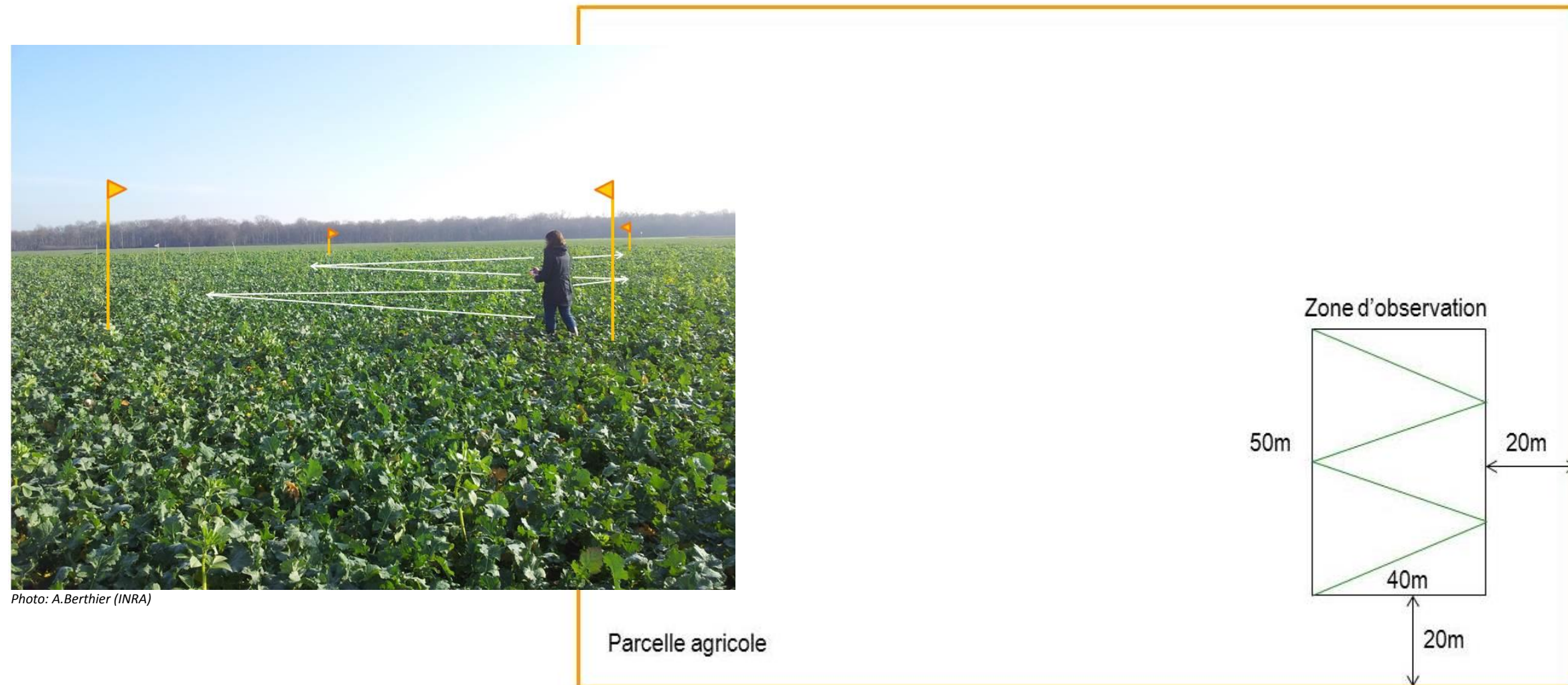
Figure 1 : dispositif du suivi simplifié des adventices sur une zone d'observation

Le suivi des adventices est réalisé sur une aire géoréférencée de 2000m 2 homogène (topographie, type de sol, pierrosité, ...) et représentative de la parcelle. La localisation de la zone d'observation est identique d'une année sur l'autre. L'observateur effectue un déplacement en W dans la zone d'observation.